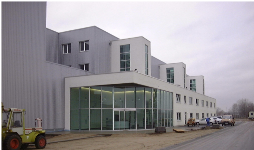
Office and social wings